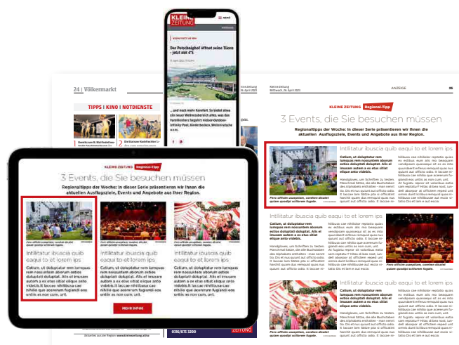
Beispiel für die crossmediale Auspielung je Regionaltipp

Keine weiteren Rabatte möglich. Mit Auktionsguthaben abrechenbar.