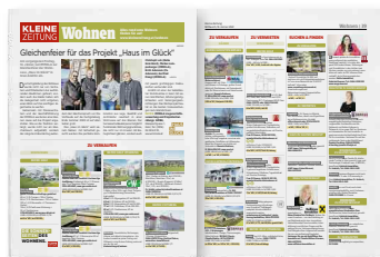
Zweitmarkt Wohnen am Mittwoch

Alle Preise verstehen sich in Euro, zuzüglich 5 % Werbeabgabe und 20 % Umsatzsteuer.