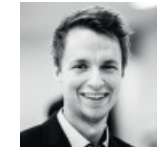
Moderation: Mathias Pascottini