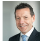
Mag. Nikolaus Lallitsch Raiffeisen Immobilien

Effizient und zukunftsicher investieren.